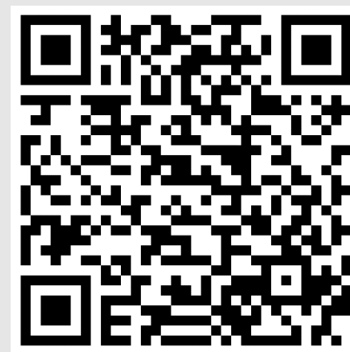
APP UPC APPLE STORE