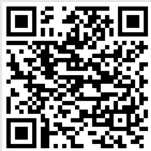
APP UPC GOOGLE PLAY