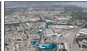
Vilanova i la Geltrú